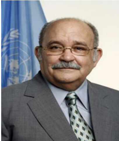
Padre Miguel d'Escoto Brockmann, en Naciones Unidas, Nueva York, 14 de septiembre de 2009.