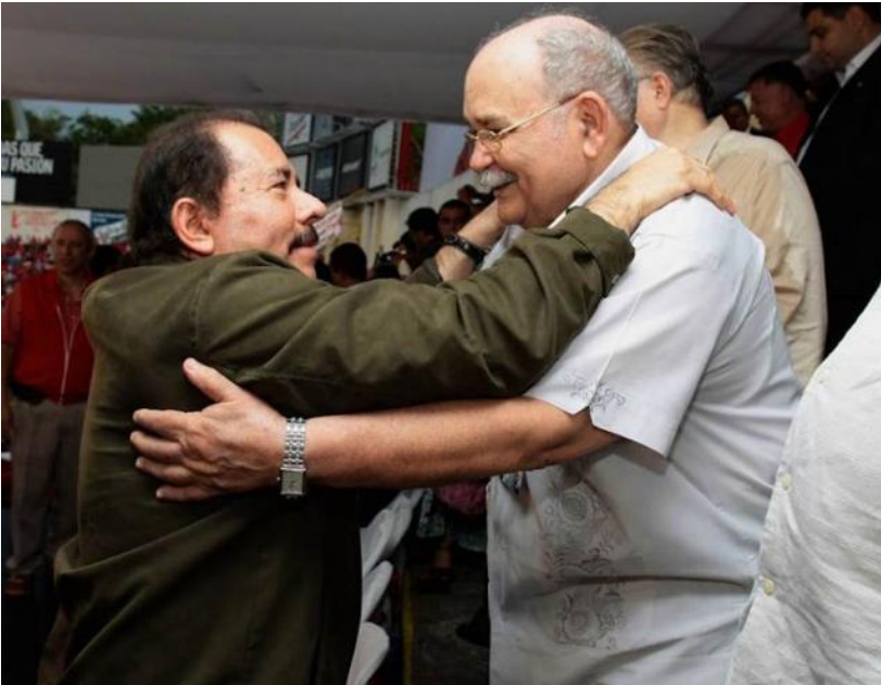
Comandante Daniel Ortega, Presidente de Nicaragua y el Padre Miguel d'Escoto Brockmann canciller de la dignidad

Miguel d'Escoto Brockmann fue un militante sandinista, intelectual, comunicador, teólogo, figura irrepetible de la Revolución Sandinista. Vivió por los humildes y caminó con los pobres del mundo, su ejemplo para los revolucionarios nicaragüenses es imperecedero.